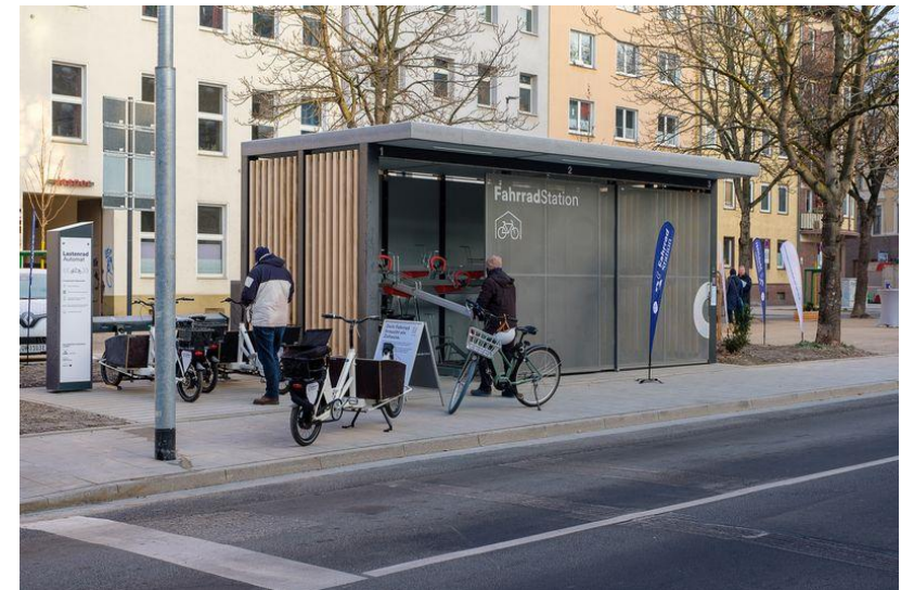
Mobilitätsstation am Bachplätzchen; Foto: Uwe Schaffmeister [9]